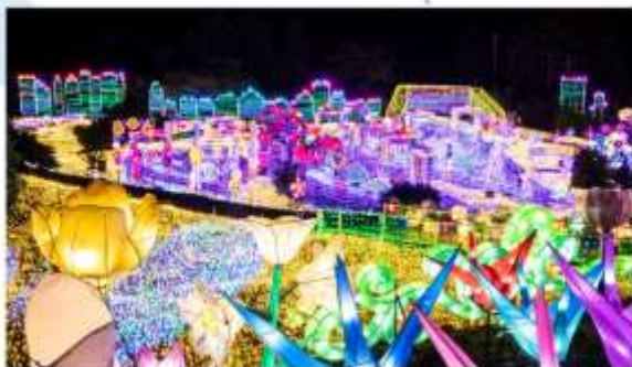
อิสระอาหารค่ำตามอัธยาศัย (เงินคืนจากบัตรเครดิต ค่าเช่า: 3,000 Yen)

ชมงานประดับไฟสุดยิ่งใหญ่ "สวนอิซุ แกรนด์พาว์" เหมือนหลุดเข้าไปในโลกแฟนตาซี มีทั้งอุโมงค์ไฟที่ยาวสุดลูกหูลูกตา สวนดอกไม้ที่ทำจากแสงไฟสวยๆ และโซนอื่นๆ อีกเพียบ นอกจากนี้ยังมีกิจกรรมโหนสลิงชมวิวงานประดับไฟจากมุมสูง เป็นประสบการณ์ที่ตื่นเต้นและน่าจดจำเป็นอย่างมาก