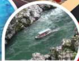
ล่องเรือใบแม่น้ำช่องเขาโอบิเคะ

Wifi on bus บริการน้ำดื่ม 10 คน ออกเดินทาง