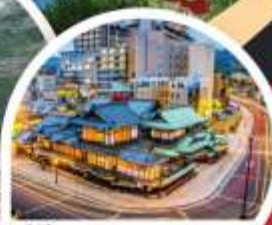
โตโกะออนเซ็น

Wifi on bus บริการน้ำดื่ม 10 คน ออกเดินทาง