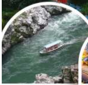
ส่องเรือใบแม่น้ำ ช่องเขาไอโนะเคะ