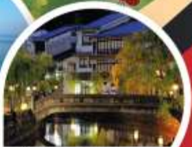
คิโนซากิ ออนเซ็น