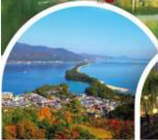
อามาโนะฮาชิดาเตะ