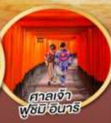
ศาลเจ้า ฟูชิมิ อินาริ