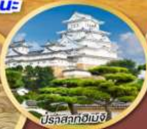
ปราสาทฮิเมจิ