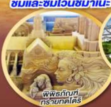
พิพิธภัณฑ์ ทรายทตริ

พิพิธภัณฑ์ทรายทตริ แห่งเดียวของโลก ขอพรความรัก "ศาลเจ้าอิชิโมะโทชะ" ดินแดนแห่งเทพเจ้า ชมและชิมไวน์ชิมามะ