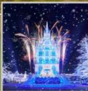
"HUIS TEN BOSCH"