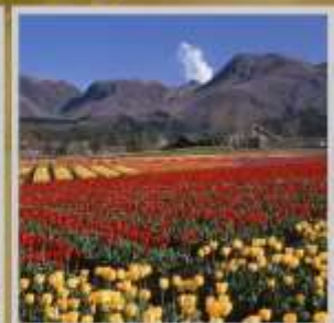
"KIJU HANA PARK"