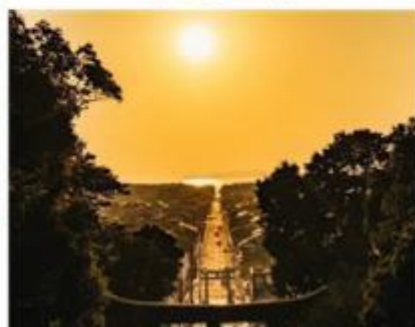
ศาลเจ้ามิยาจิดาเกะ Miyajidake Shrine

จากนั้นนำท่านเดินทางกลับสู่ เมืองฟูกุโอกะ เมืองใหญ่อันดับ 6 ของญี่ปุ่น และเป็นเมืองที่ได้รับการจัดอันดับว่าเป็นเมืองน่าอยู่อันดับที่ 12 ของโลก