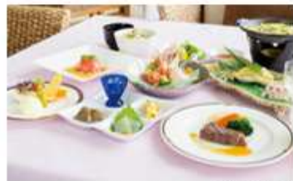
รับประทานอาหาร (Kaiseki)