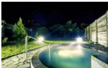
บ่อน้ำร้อน