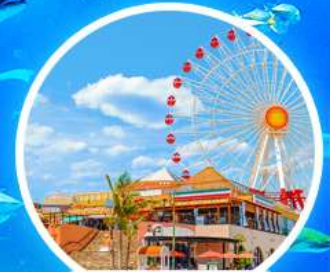
หมู่บ้านอเมริกัน