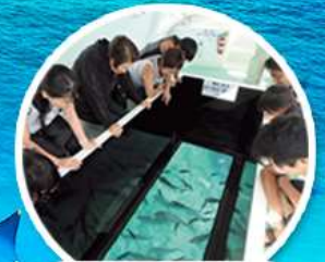
ล่องเรือกระจก