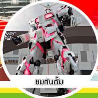
ชมกันดั้ม