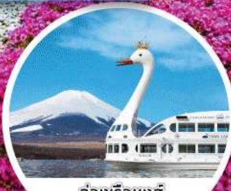
ล่องเรือหงส์