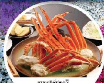
ขาปูยักษ์