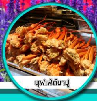
บุฟเฟ่ต์ขาปู